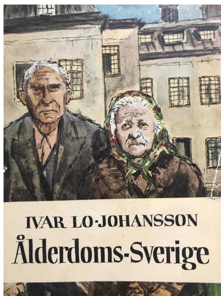
Ivar Lo-Johansson

Jag tänkte ungefär så här. ”Om jag nu deltar i debatten om svensk äldreomsorg borde jag inte då läsa in mig på när den stora striden stod?”