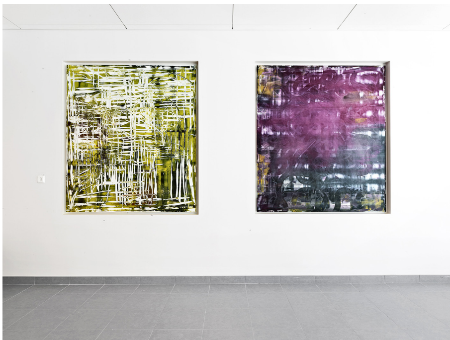
Två målningar av Håkan Rehnberg, 2011. Oljefärg på sandblästrat akrylglas. Placering: sidoentrén till vård- och omsorgsboendet, Stockholms Sjukhem.