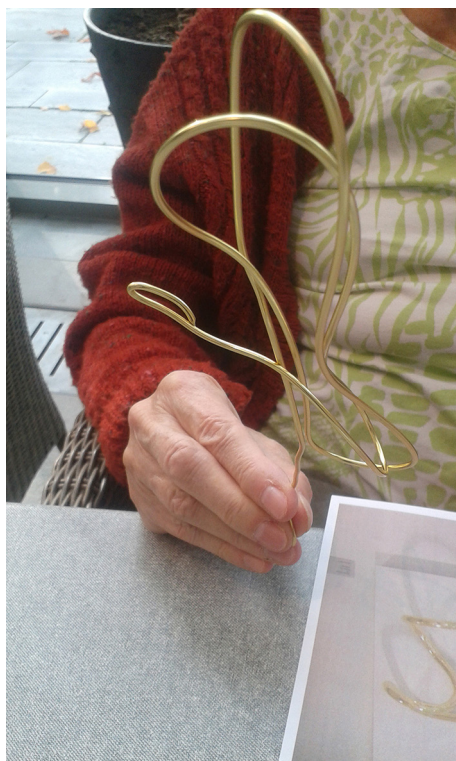
Arkivmaterial från Konststunder på Stockholms Sjukhem.

blivit sedda och berört ens känslor! Jag betonar gärna detta: Att ta till sig konst är en aktiv handling. Vi kan ta vara på den energi som finns i det motstånd som ibland uppstår.