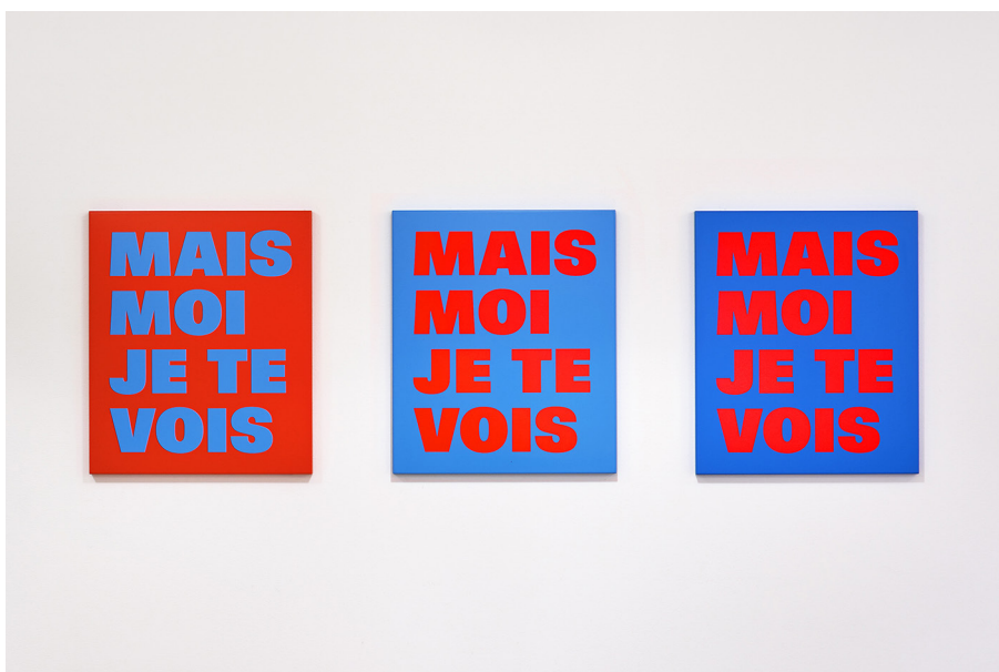
Mais moi je te vois av Rémy Zaugg, 1994/2001. Lackfärg på aluminium. Placering: i anslutning till aulan, Stockholms Sjukhem.