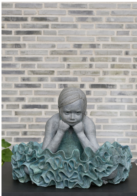
In Search of a Winner av Assa Kauppi, 2013. Patinerat brons. Placering: orangeriet, Stockholms Sjukhem.

och fördjupar samtalet om det kringelikrokiga verket. ”När jag är berusad så brukar jag gå så där, är det något att göra konst av?” ”Ser ut som förgylld, kokt gammal spagetti som stelnat på tallriken.” ”Det är som ett smycke, som en vacker brosch att fästa på blusen.”