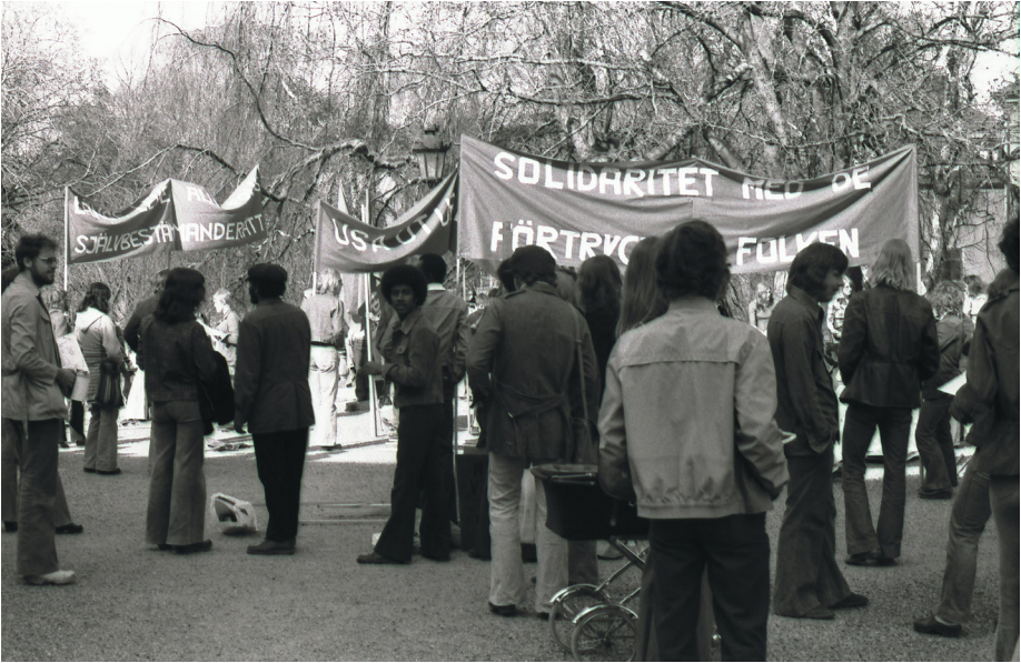
Sandöelever genomför en solidaritetsaktion i Kramfors.