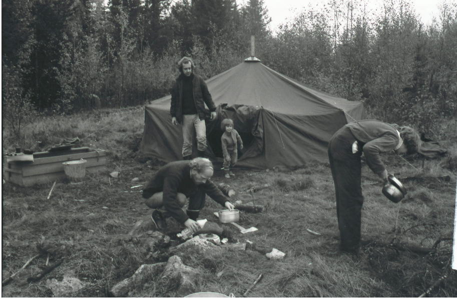
Vi skulle överleva i naturen och tillbringade flera veckor, sommar som vinter, i tält.